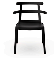
High Tokyo Black Chair 01626..4X.