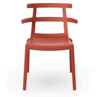
Tokyo Greda Chair 07207..4X.