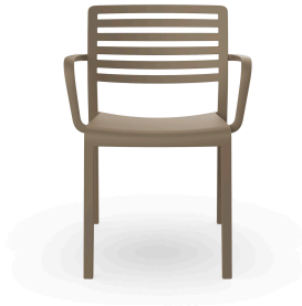
Lama Armchair Sand 01326..4X.