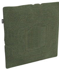
Cojín Decorativo Brisa Fern 06820