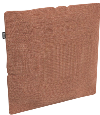
Cojín Decorativo Brisa Amber 06819