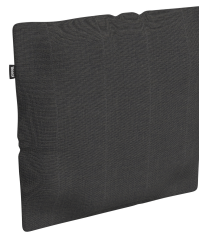
Cojín Decorativo Brisa Dolce 55 06821