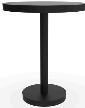
Mesa Barcino Ø60 Pie Central Negra 01432