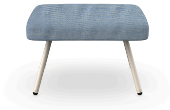
Puf Anou Nacar Denim 07069