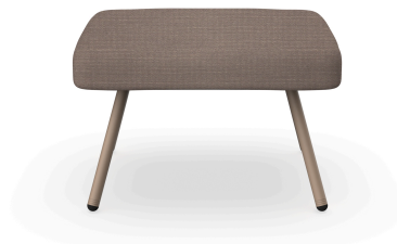
Puf Anou Duna Mocha 07073