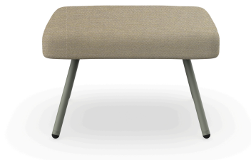
Puf Anou Salvia Limonetto 07072