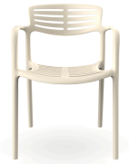
Silla Toledo Aire Nácar 06834