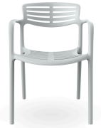
Silla Toledo Aire Luna 06840