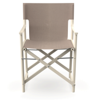
Silla Boss Nácar Tejido Mud 06827