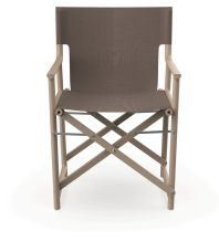
Silla Boss Duna Tejido Mocha 06825