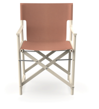
Silla Boss Nácar Tejido Amber 06826