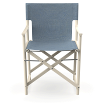
Silla Boss Nácar Tejido Denim 06828