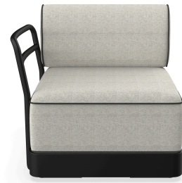
Brisa Terminal Noche Cojin Salina 05 + Dolce 55 06883