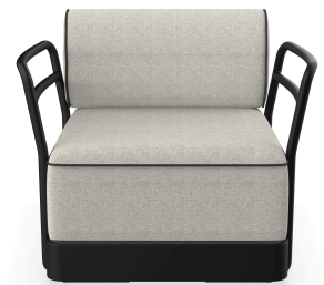
Sillon Brisa Noche Cojin Salina 05 + Dolce 55 06804