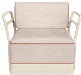
Sillon Brisa Nácar Cojin Hazelnut + Amber 06802