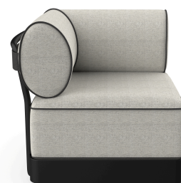
Brisa Corner Noche Cojin Salina 05 + Dolce 55 06800