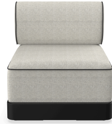
Brisa Basic Negro Cojin Salina 05 + Dolce 55 06796