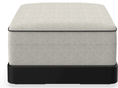
Brisa Ottoman Noche Cojin Salina 05 + Dolce 55 06792..1X.