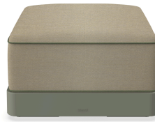
Brisa Ottoman Salvia Cojin Limonetto + Fern 06791..1X.