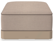
Brisa Ottoman Duna Cojin Mud + Mocha 06789..1X.