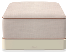
Brisa Ottoman Nácar Cojin Hazelnut + Amber 06790..1X.