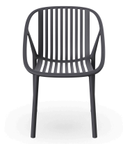
Silla Bini Gris Oscuro 05376