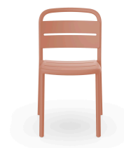
Silla Como Terra Cotta 05347