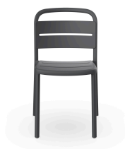
Silla Como Gris Oscuro 05344