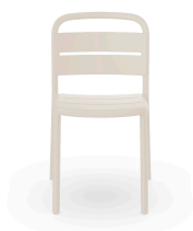
Silla Como Marfil 05343