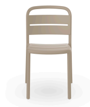
Silla Como Arena 05346