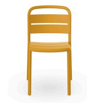
Silla Como Toscano 05348