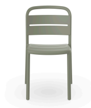
Silla Como Gris Verdoso 05345