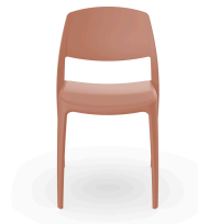
Silla Smart Terra Cotta 05368