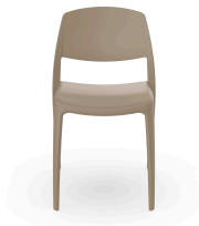
Silla Smart Arena 05366