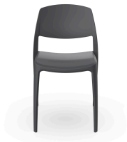
Silla Smart Gris Oscuro 05365