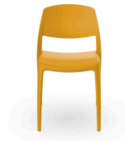
Silla Smart Toscano 05369