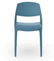
Silla Smart Azul Retro 05367