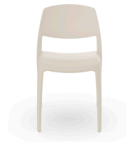
Silla Smart Marfil 07114