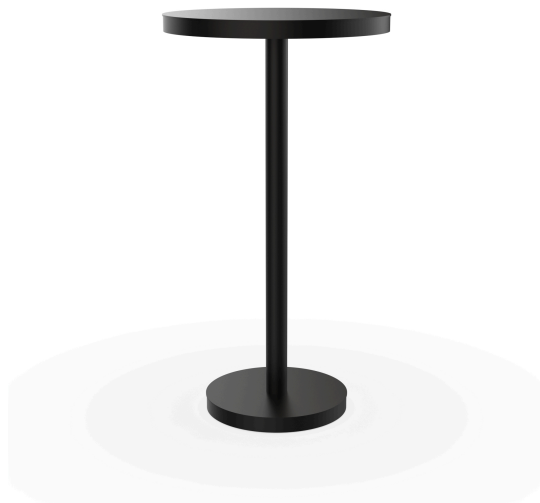
Mesa Barcino Ø60 Pie Central Alto Negra 01434