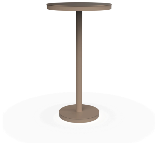
Mesa Barcino Ø60 Pie Central Alto Arena 01433