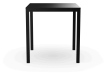
Mesa Barcino 70x70 Negra 01403