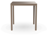
Mesa Barcino 70x70 Arena 01402