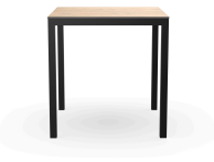
Mesa Barcino 70x70 Compact Roble Natural/Negra 04023