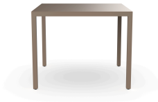
Mesa Barcino 90x90 Arena 01400