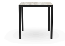
Mesa Barcino 70x70 Compact Madera Lavada/Negra 04021