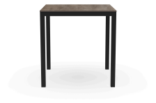
Mesa Barcino 70x70 Compact Roble Ceniza/Negra 04022