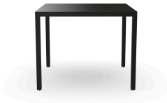
Mesa Barcino 90x90 Negra 01401