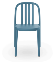
Silla Sue Lamas Azul Retro 05170