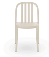
Silla Sue Lamas Marfil 07141