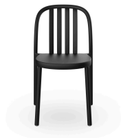
Silla Sue Lamas Negra 05168