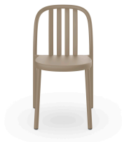
Silla Sue Lamas Arena 05169