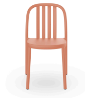
Silla Sue Lamas Terra Cotta 05172