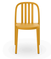
Silla Sue Lamas Toscano 05171