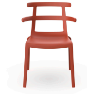
Silla Tokyo Greda 07207