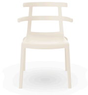
Silla Tokyo Nuevo Marfil 01617