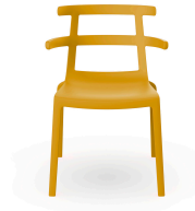
Silla Tokyo Toscano 01624