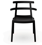
Silla Tokyo Negra 01626