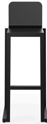
Taburete Barcino Negro 01398