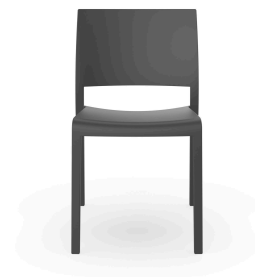
Silla Fiona Gris Oscuro 01802