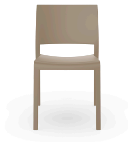
Silla Fiona Arena 00950